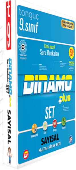
9. Sınıf Dinamo Sayısal Set