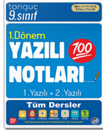
9. Sınıf Yazılı Notları 1. Dönem 2. Yazılı