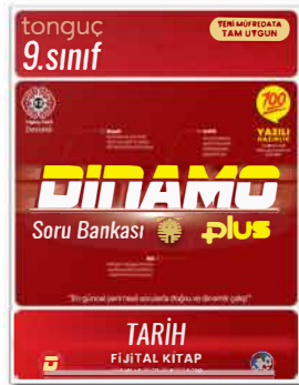
9. Sınıf Dinamo Tarih Soru Bankası