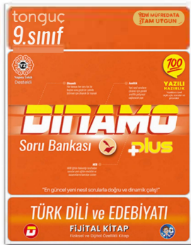
9. Sınıf Dinamo Edebiyat Soru Bankası