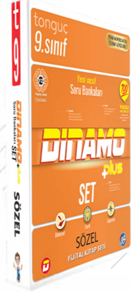
9. Sınıf Dinamo Sözel Set