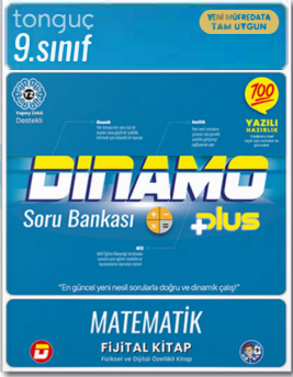
9. Sınıf Dinamo Matematik Soru Bankası