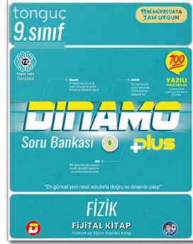
9. Sınıf Dinamo Fizik Soru Bankası