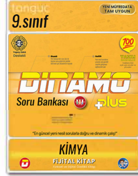
9. Sınıf Dinamo Kimya Soru Bankası