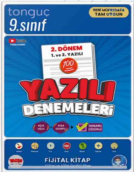
9. Sınıf Yazılı Denemeleri 2. Dönem 1 ve 2. Yazılı