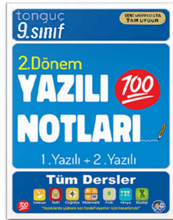
9. Sınıf Yazılı Notları 2. Dönem 1 ve 2. Yazılı