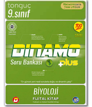
9. Sınıf Dinamo Biyoloji Soru Bankası