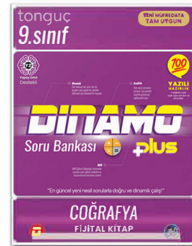
9. Sınıf Dinamo Coğrafya Soru Bankası